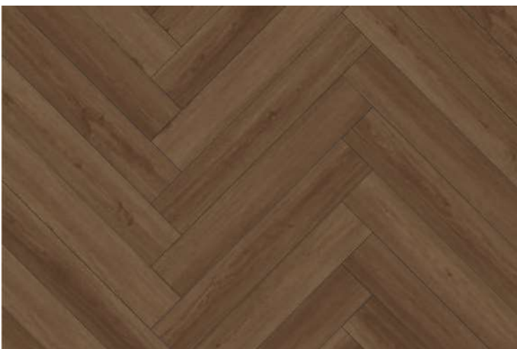
Sand Walnut DMP703A/B