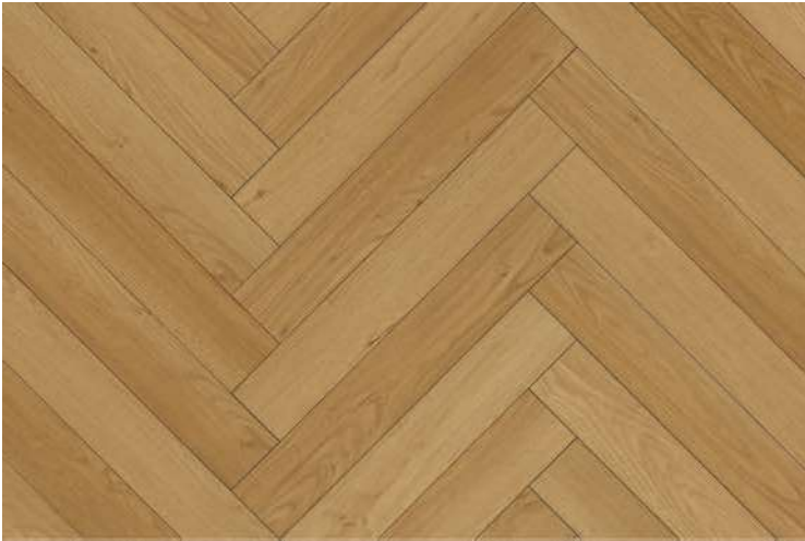
Sand Maple DMP701A/B