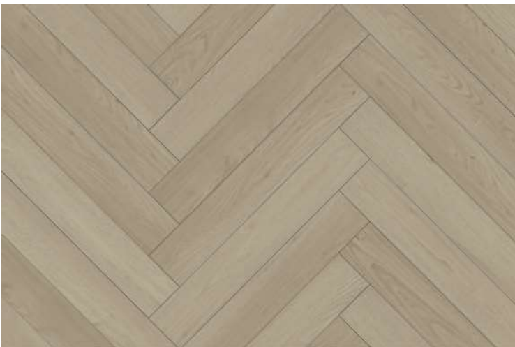
Sand Beech DMP702A/B